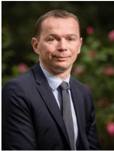
Olivier Dussopt Ministre du Travail, du Plein emploi et de l'insertion

Objectif plein emploi. Cette ambition qui, hier, semblait le souvenir diffus d'une époque révolue, redevient aujourd'hui une réalité à portée de main.