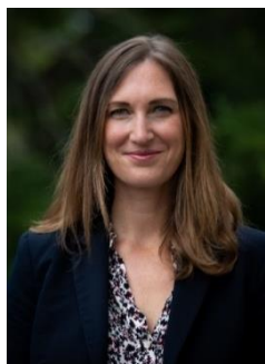
Carole Grandjean Ministre déléguée chargée de l'Enseignement et de la Formation professionnels

Réforme par réforme, proposition par proposition, je sais pouvoir compter sur des partenaires sociaux pleinement engagés dans les concertations à venir en faveur du plein emploi.